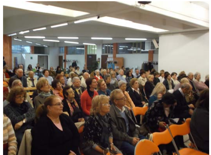
parte dell'assemblea alla convocazione